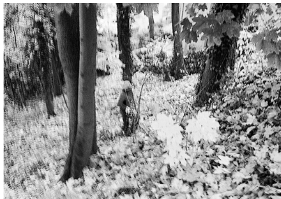
Lerchenwald: «Geheimaktion» mit Motorsäge in der Morgenfrühe: Unterholz wegfräsen!

willigte am 3. November auch noch ein Gesuch um die Fällung von zwei geschützten Bäumen (je ein Spitz- und Bergahorn). Dies mit der Begründung, dass der naturschutzrechtliche Wert der Parzelle damit nicht beeinträchtigt werde. Allerdings forderte die Stadtgärtnerei die Bauherrschaft Swisslife unmissverständlich auf, dass diese die Anwohnerschaft umfassend informiert. Eine Information der Anwohner ist nie