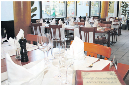
Restaurant Pizzeria Kaffi Sandwich am Tellplatz: Neu mit mediterraner Küche und schönem Gedeck.

Auberginen), Kazu Bifteak (Lammgigotsteak auf heissem Stein serviert mit 3 Saucen) oder, auf vegetarische Art, Imam bayildi (gefüllte Aubergine mit Weizenpilav und Yoghurtsauce) und Falafelteller (Kichererbsenkugeln, Humus, Pilav). Dazu können frische Salate genossen werden: grüner oder Tomatensalat, Insalata Caprese (mit Mozzarella), Rucolasalat mit Parmesan,