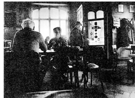
Altes Gundeli: Restaurant «Zur Wanderruh».

Die Sitzplätze vor den Restaurants am Tellplatz sind leer und von den Bäumen wirbelt das welke Laub über den weiten Platz. Wenn nun die Blätter fallen, wenn es nebelt und ein kühl-feuchtes Lüftchen weht, gewinnt halt das Ofenbänklein (falls noch vorhanden) in der Stube seinen Reiz. In der warmen Stube zusammensitzen, spielen, erzählen, diskutieren – oder als Single lesen, Musik hören oder gar selbst musizieren... Es ist auch die Zeit, in der einschlägige Lokale besonders verlockende Herbstmenüs offerieren und dazu originale Musik darbieten (wie z.B. im Restaurant «Viertelkreis» jeden Dienstagabend ein Ohr voll guten Jazz offeriert). Nutzen wir diese kurze natürliche Besinnungspause vor dem Winter und seinen Festtagen zu einem gemütlichen Verschmaufen in der Behaglichkeit drinnen... wenn draussen der November (der Nebelmonat) herrscht. Diese Einkehr ins Innere, besonders nach einer langen Saison im Freien mit viel Luft und Sonne (und wenig Regen) tut allen gut. Werner Gallusser