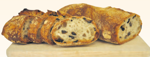
Olivenbrot, 300 g 2.80 (100 g = -.94)

Die vielfältigste Coop-Auswahl der Stadt Basel bietet der Südpark. Eine besondere Attraktion für die Sinne ist die Hausbäckerei. Einerseits, verströmt sie den verführerischen Duft nach ofenfrischem Brot. Andererseits gehen die Bäcker und Konditoren ihrem Handwerk direkt vor den Augen der Kundschaft nach. Sie sorgen täglich für frisches, genussvolles Brot bis Ladenschluss. Die im Südpark hergestellten Spezialitäten erkennen Sie an der Aufschrift «Aus der Hausbäckerei». Geniessen Sie beispielsweise das Huusbrot hell oder dunkel oder die feinen Zöpfe. Auch Naschkatzen kommen dank den Konditoren der Hausbäckerei auf ihre Kosten. Die Auswahl reicht von Cremeschnitten bis zu Früchtetorten. hap