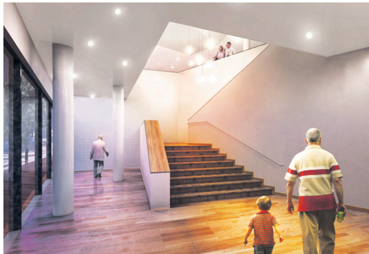
Das einladende Entrée heisst Bewohner und Besucher willkommen. Abb: HdM

Interessentinnen und Interessenten werden unter Tel. 061 366 55 55 unverbindlich beraten. Allgemeine Informationen sind auch im Internet unter www.residenz-suedpark.ch verfügbar. ■