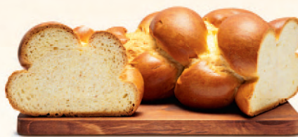
Butterzopf 500 g 3.30 (100 g = -.66)