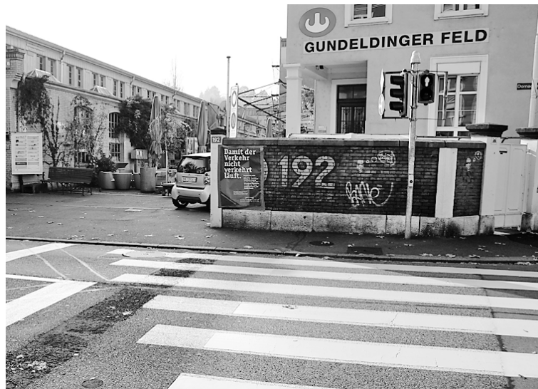
Nach über 4 Jahren Warten: Endlich wurde der erwünschte Fussgängerstreifen beim Eingang Gundeldinger Feld angepasst und verbreitert.