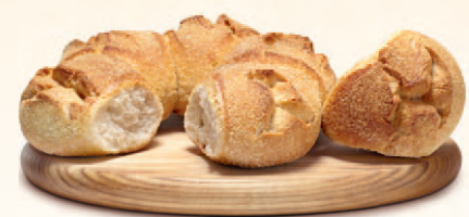
Chrustenkranz 400 g 2.70 (100 g = -.68)