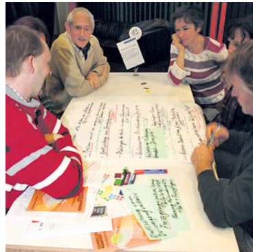
An den Tischgesprächen wurde intensiv und nach schriftlichem Festhalten der Themen ausgiebig darüber diskutiert, was für unser Quartier das Beste sein könnte. Auch Sie – liebe Leserin und lieber Leser – waren eingeladen zum Mitreden, zum Mitmachen...! Also keine Reklamationen hinterher...

Versammelt hatten sich die Repräsentanten von Interessensgruppen, Gewerbetreibende und Privatpersonen aus dem Gundeli, aber auch Lokalpolitiker aller Couleurs. Das