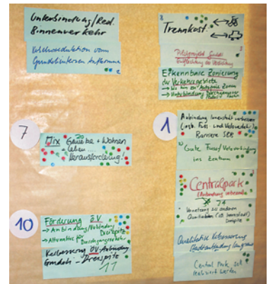
Gundeldinger Wunschliste: 1. CentralPark, 2. Tempo 30... mehr dazu in der nächsten GZ vom 30.11.11.

Dreimal – nach je 20 Minuten – wechselten die Teilnehmer zu anderen Tischen mit Ausnahme des so genannten Gastgebers, der die neuen Tischgäste mit den vorher festgehaltenen Wünschen und Thesen bekannt machte. Auf diese Weise entwickelte sich nach gut zweieinhalb Stunden ein umfassendes Netzwerk von Gedanken und Ideen, die nach Abschluss dieser Diskussionsphase von den jeweili-